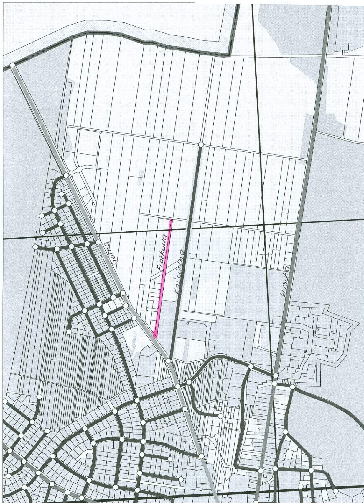
Mapa wydrukowana w dniu 29.11.2012